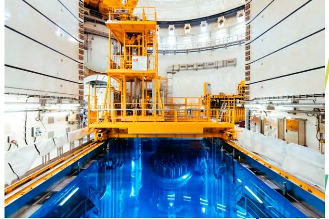
Olkiluoto 3.