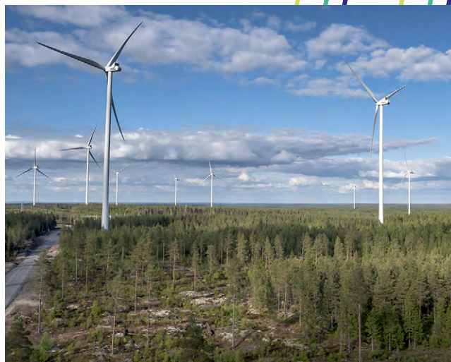
Vindpark i Närpes.