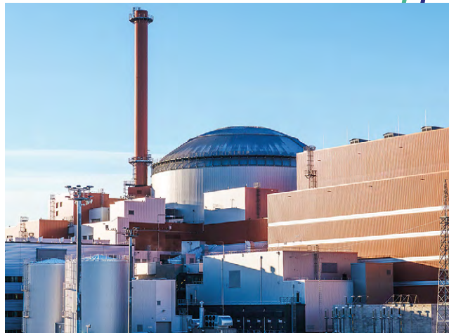
Olkiluoto 3.

Energikrisen blev lindrigare jämfört med året innan vilket återspeglades i en nedgång av partimarknadspriset på el. I synnerhet i slutet av våren och i början av sommaren sjönk priserna och var tidvis mycket låga. Prisnivån är ändå fortfarande tydligt högre än i början av krisen. Medelpriset under perioden var 57,9 €/MWh.