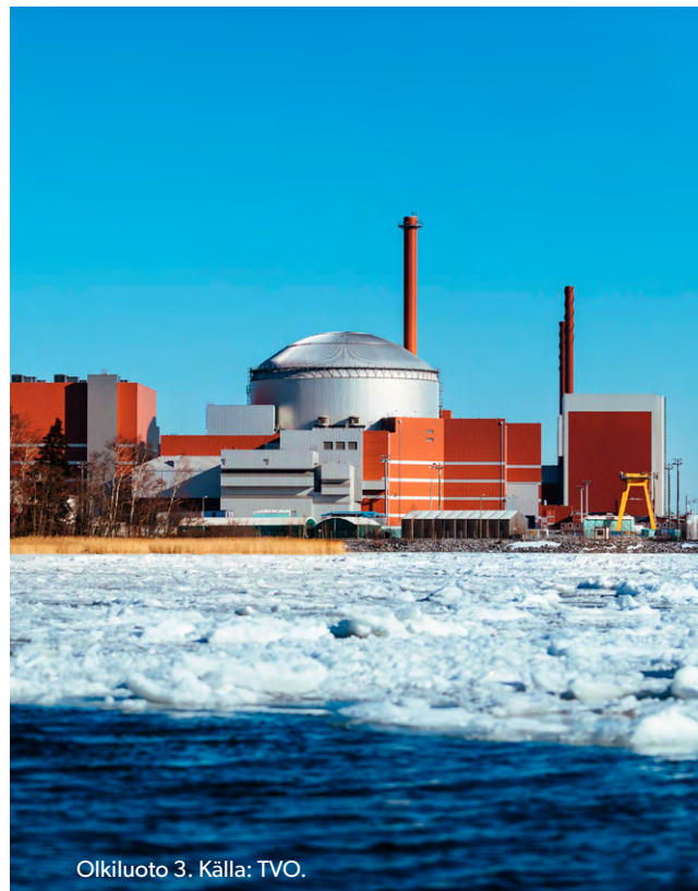
Olkiluoto 3.

Partimarknadspriset på el i Finlands prisområde sjönk med 8 procent jämfört med början av 2023. Medelpriset under perioden var 67 €/MWh. Spotpriset i Finlands prisområde var i genomsnitt 11 €/MWh högre än det allmänna systempriset på börsen.